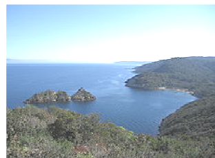
Plage de la Palud et rocher du Rascas

Départ de l'excursion à 10h45 en direction du Fort du Moulin puis du nord est et de la plage de la Palud (cf. carte ci-dessous) environ 1 heure en comptant les arrêts « bota » et photos